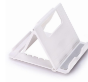
Smartphone Hal- ter