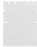
Ständer für Ketten und Ohrringe