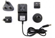
Universeller Netzadapter (100- 240V, 12V 3.0A)